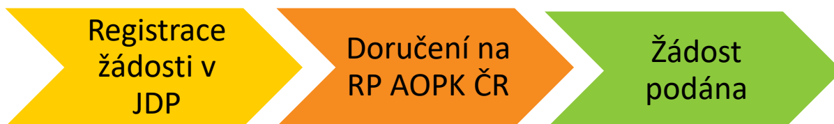
Obr. 1 – Kroky vedoucí k podání žádosti

Žadatel po registraci žádosti vygeneruje její tiskovou verzi ve formátu pdf a podepíše, čímž stvrdí čestná prohlášení a všechny skutečnosti uvedené v žádosti o dotaci. Ve lhůtě maximálně 5 pracovních dnů od registrace žádosti v JDP podepsanou tiskovou verzi žádosti (včetně všech příloh požadovaných dle kap. B.3 a příloh č. 3 a 4 této Příručky, které žadatel nevložil do JDP) doručí na AOPK ČR. Pokud je vytištěná žádost doručena osobně anebo poštou, bude žadatelem podepsána fyzicky. Žádost lze doručit i datovou schránkou