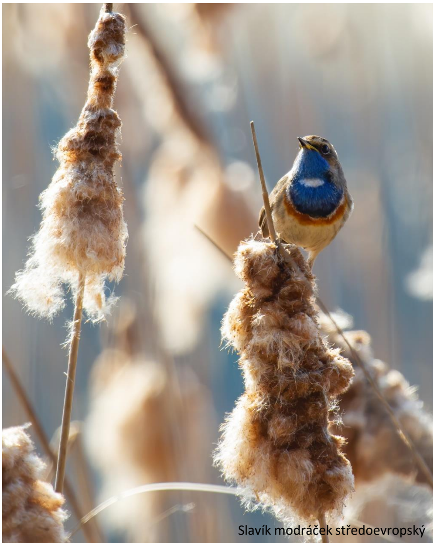
Slavík modráček středoevropský